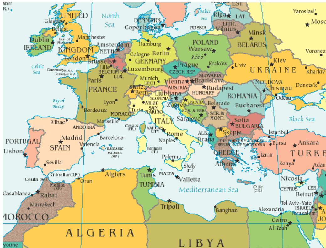
Mapa Político del Mar Mediterráneo

CIA: Political Map of the World, June 1999, Scale 1:35,000,000 Standard parallels 38°N and 38°S. Robinson Projection