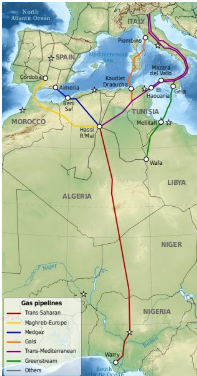
Fig. 1: Gasoductos desde el Mágreb hacia las tierras europeas

Gasoducto Maghreb-Europa / Gasoducto Trans- Mediterráneo / Gasoducto Greenstream