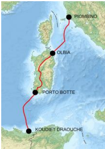
Fig. 4, mapa de ubicación de GALSI

La sección de Cerdeña está prevista aproximadamente en unos 300 kilómetros desde Porto Botte a Olbia . La sección de alta mar entre Cerdeña y la península