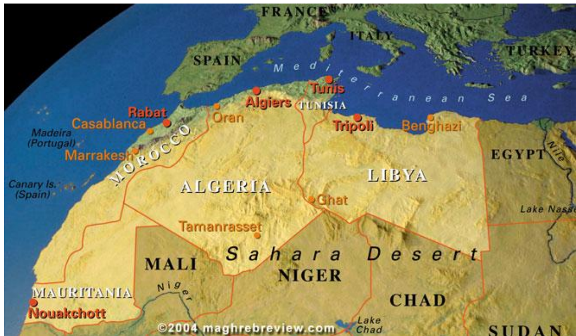
Mapa del nord-occidente del Norte de África utilizado por The Magreb Review

atender al uso moderno del vocablo geográfico de Mágreb, este comprende las unidades políticas de Marruecos, Argelia, Túnez, Libia y Mauritania. Hacia el norte, la región está delimitada por el mar Mediterráneo, y al oeste con el Océano Atlántico, que va desde el estrecho de Gibraltar hacia el suroeste hasta los desiertos de Mauritania. El límite oriental es abierto geográficamente, y algunos geógrafos árabes medievales hicieron que los países del Magreb comienzan hacia el oeste de Alejandría, en Egipto, aunque la mayoría acepta que Egipto, de hecho, está fuera del Magreb.