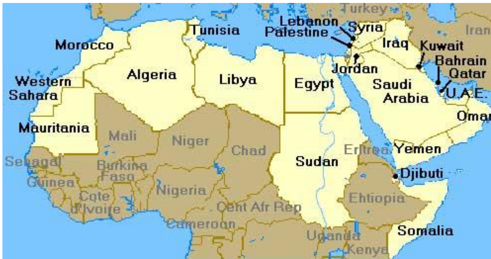
Países del Mundo Árabe( al-'ālam al-'arabī) www.arabe.cl

En los primeros meses del año 2011 las sociedades políticas nacionales localizadas en el área occidental del norte de África (Marruecos + Sáhara Occidental, Argelia, Túnez, Libia y, en alguna medida, Mauritania) fueron despertadas por el accionar de sus propios gobernados y gobernantes en orden a generar nuevos caminos que mejor bosquejen y objetiven su concepción política de “bien común”, sin ignorar sus connotaciones de ser y formar parte de la sociedad mundial de entidades geográficas. Se ha de tener en cuenta que el “mundo Árabe” aquí representado en un mapa político de estados nacionales (hasta hoy 22, salvo el Sáhara Occidental incorporado a Marruecos) es observado por los geógrafos desde muy antiguo, como dos grandes áreas geográfico-culturales: Mágreb y Máshreq .