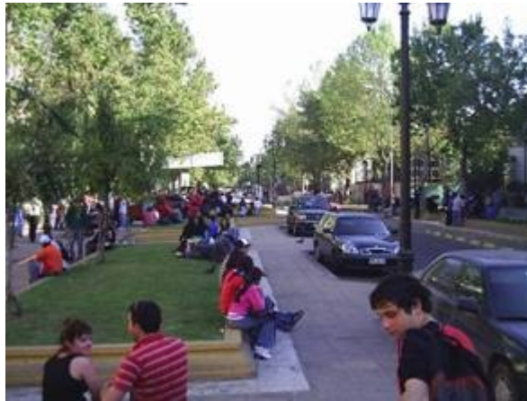
Foto N°2. este es el panorama de la calle República hoy, en contraste lo que ella significó en el siglo pasado.