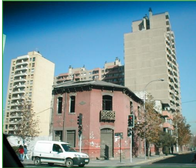
Foto n°1. Este es un típico ejemplo de Renovación urbana en que se advierte cómo los nuevos edificios van acorralando a los viejos.

abarcan 709827 m 2 , cantidad que aumenta para el año 2006 comprometiendo un total de 851013 m 2 en un total de 46 proyectos, para los primeros meses del año 2007, la cantidad de proyectos autorizados fue de 37 con un total de 438357 m 2 conformando una cantidad de viviendas de alrededor de 7000 viviendas. Esta situación día a día se ve incrementada dejando huellas que son percibidas en muchos sectores de la comuna. Esta dinámica ha sido diferencial según barrios, siendo uno de los barrios más afectados el barrio Balmaceda (Ver Foto n° 1)