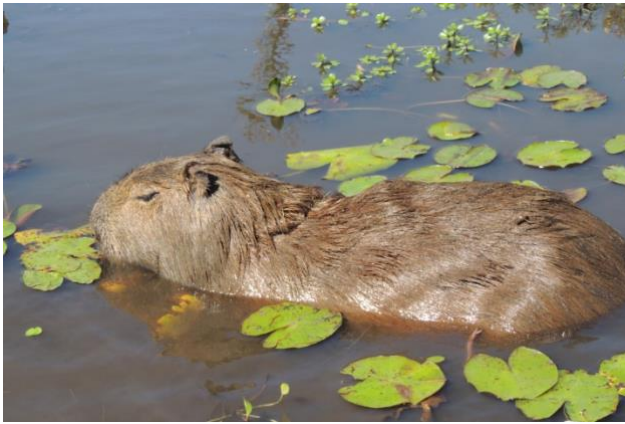
Fotografía N° 1. Carpincho